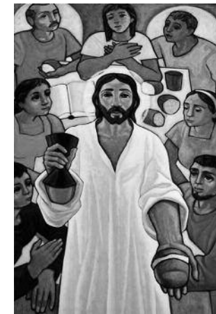
Ilustración: MAXIMINO CEREZO

"El Domingo es la fiesta primordial, que debe presentarse e inculcarse en la piedad de los fieles, de modo que sea también día de alegría y de liberación de trabajo" 13 . Esta afirmación del Concilio Vati-